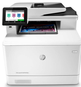
Impresora HP Color LaserJet Pro M479dw

El éxito profesional es sinónimo de una forma de trabajo más inteligente. La impresora multifunción HP Color LaserJet Pro M479 se ha diseñado para que puedas centrarte más en el crecimiento de tu empresa y situarte un paso por delante de la competencia.