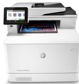
Impresora HP Color LaserJet Pro M479fnw

Impresora con seguridad dinámica habilitada. Para ser exclusivamente utilizada con cartuchos que utilicen un chip original de HP. Es posible que no funcionen los cartuchos que no utilicen un chip de HP, y que los que funcionan hoy no funcionen en el futuro. Obtenga más información en: http://www.hp.com/go/learnaboutsupplies